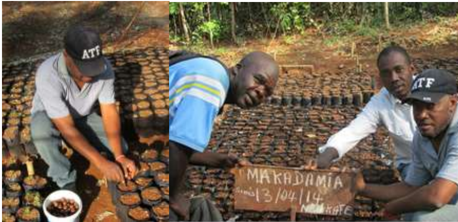
200 macadamia zaadjes planten op l'Île de la Gonave

In maart 2014 hebben we 2000 macadamia zaadjes als cadeau gekregen van uit de Dominicaanse Republiek voor ons project. Deze zaadjes werden geschonken aan een school, een weeshuis en twee organisaties. De helft van de boompjes zijn ontkiemd.