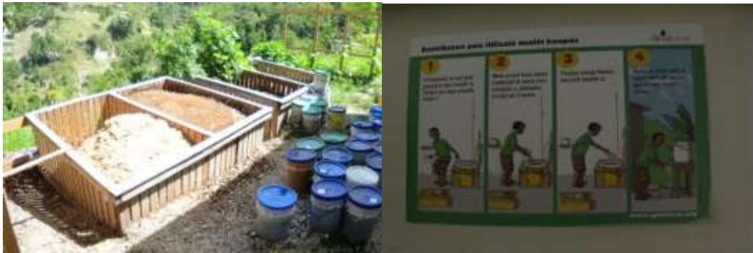
Droog toilet, Haitian Academy Biaco Malique