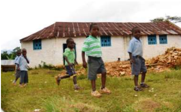
Kinderen die op hun schoolplein staan in Baptiste