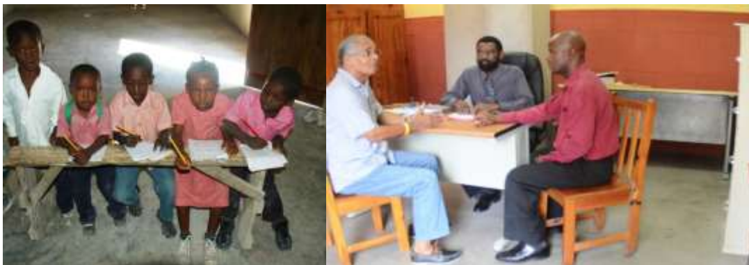
École Morne Garnier, La Gonâve

Belangrijk voor ons is om het komende jaar ons kantoor in Haïti in te richten. We hebben alles nodig zoals stoelen, tafels, bureaus enz. We vragen aan kennissen, vrienden en leden ons te helpen deze meubels te vinden.