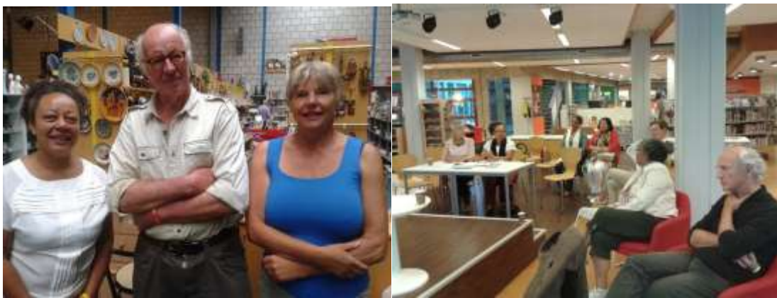
Stichting KOOK, Vereniging Green School Haïti en la Fondation l'École Verte d'Haïti

Zij hebben 5.000 euro gedoneerd voor ons project Solitair!